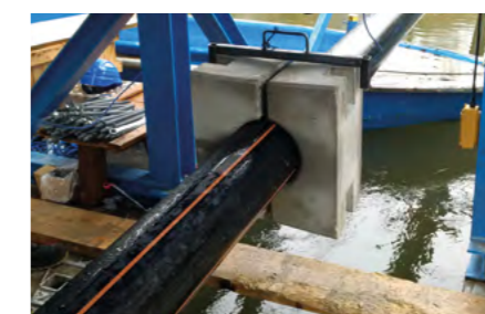
Použití jako fixace pro normá závaží trubek vedených pod vodní hladinou.