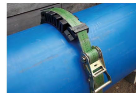
Montáž pomocí upínacího popruhu.

Požadavek na upínací popruh: – šířka popruhu 50 mm – délka popruhu cca 3,5 x průměr trubky, resp. při vícenásobném použití příslušně delší