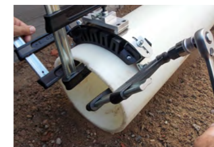
Montáž pomocí upínacího zařízení FRIATOOLS FIXBLOC FWFB.

Pomocí upínacího zařízení FRIATOOLS FIXBLOC FWFB lze montovat FIXBLOC na PE trubky o průměru d 160 až d 500 na řezné hraně trubky.