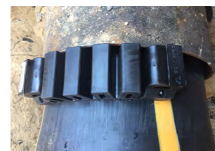
Použití FIXBLOCu jako pojistky proti zpětnému vtažení do staré trubky při sanaci.

Při sanaci či rekonstrukci trubek. Díky účinku ochlazování má zatažená PE trubka nebo Close-fit U-Liner/C-Liner tendenci se vtáhnout zpět do starého vedení.