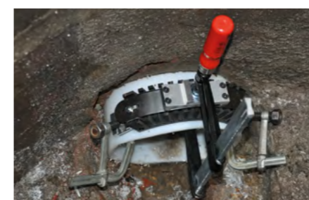
Použití FIXBLOCu jako pojistky proti zpětnému vtažení do prostupu betonové šachty při použití Close-fit technologie.